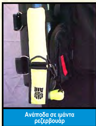
Ανάποδα σε ιμάντα ρεζερβουάρ

⚠️ ΠΡΟΕΙΔΟΠΟΙΗΣΗ: ΜΗΝ εφαρμόζετε ή μην προσαρμόζετε την θήκη του SPARE AIR στην ζώνη βαρών σας. Η ΘΗΚΗ μπορεί να εμπλακεί με την αφαίρεση της ζώνης βαρών σας σε μια επείγουσα ανάγκη και μπορεί να προκληθεί απώλεια του SPARE AIR όταν θα το χρειαστείτε περισσότερο.