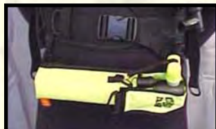
Κατά μήκος την μέσης ( μην ακουμπάει στην ζώνη βαρών)