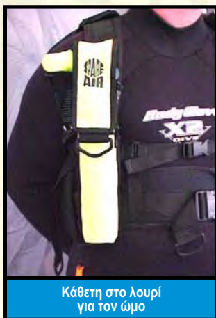
Κάθετη στο λουρί για τον ώμο