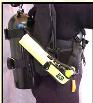
Διαγώνια από τη δεξιαμενή για να π.Χ.