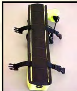
Ιμάντες μέσα από το πλέγμα για καλύτερη εφαρμογή