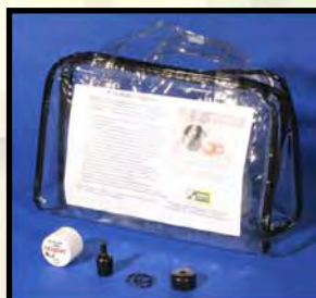
SPARE AIR Travel Pack #963