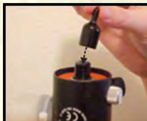
Προστατέψτε τα σιλικόνια σπρέι αέρα σε ρυθμιστή