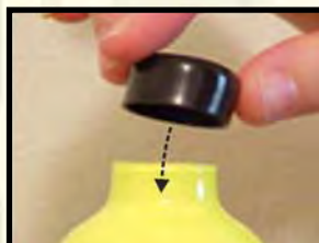
Προστατέψτε το εσωτερικό του κυλίνδρου αλουμινίου