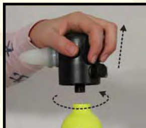
Εκκαθάριση αέρα, στη συνέχεια, περιστρέψτε ρυθμιστή αντίθετη των δεικτών του ρολογιού για να αφαιρέσετε